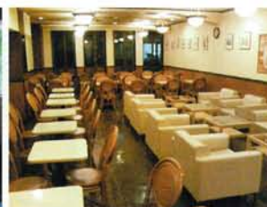
レストラン・ホール