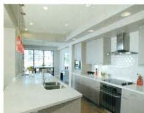
キッチン・飲食店厨房